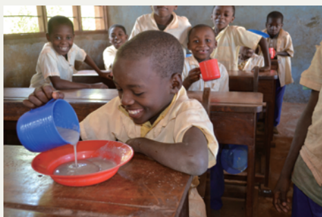
TABLE FOR TWO